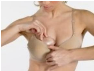
La Defensoría intervino ante denuncias de mujeres pacientes por falta de información para solicitud de prótesis mamarias.

*Defensoría lidera reforma de derechos laborales de las mujeres en campo de la maternidad y corresponsabilidad en el cuidado. (Marzo-2010)