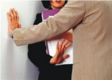
Imagen con fines ilustrativos

La Defensoría de los Habitantes informó hoy que vigilará el cumplimiento del procedimiento que deberán aplicar las instituciones públicas con motivo de las recientes modificaciones aprobadas a la Ley contra el Hostigamiento Sexual en el Empleo y la Docencia, y que entraron en vigencia recientemente con su publicación en el diario oficial La Gaceta.