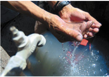
Defensoría abogó por una Ley en materia de recurso hídrico. Imagen con fines ilustrativos