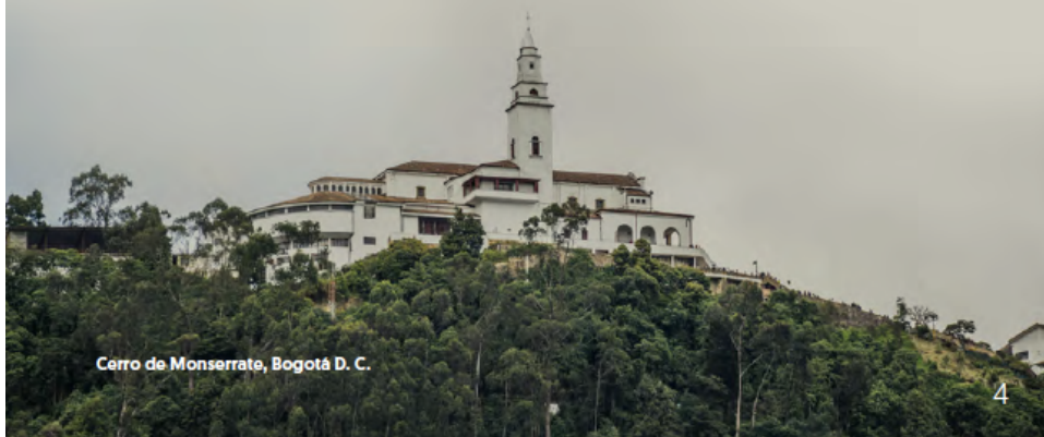
Cerro de Monserrate, Bogotá D. C.