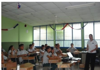
La Defensoría se reunirá el próximo martes con estudiantes del Liceo de Miramar.