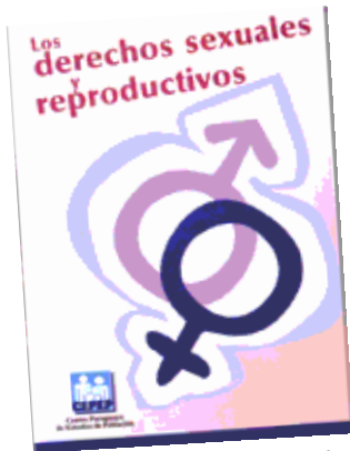
Imagen estrictamente ilustrativa

Ante esa realidad, la Defensoría recomendó reconocer la autonomía y voluntad de la persona solicitante de la esterilización, respetar el derecho al consentimiento informado y elaborar un instrumento jurídico adecuado para su regulación, entre otras cosas. Este proceso fue acompañado por muchos sectores y se tuvo como resultado un nuevo decreto para la esterilización.