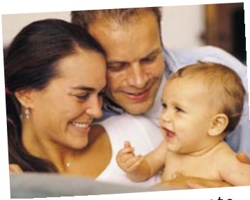
Imagen estrictamente ilustrativa

El seguimiento de esta política también se facilita por la utilización y adopción de conceptos e información actualizada, basada en la evidencia científica y accesible para todas las personas, que dan las herramientas para confrontar con quien discrepe de ella. La claridad en la definición de las áreas de intervención y de los lineamientos planteados que responden tanto a las necesidades y a la realidad de las y los habitantes, como a las competencias y responsabilidades de las instituciones y organizaciones competentes, también facilita el seguimiento de la política.