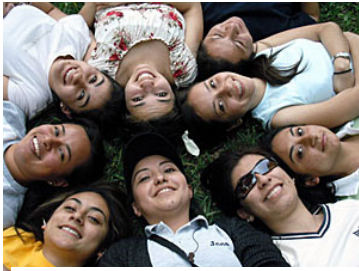
Imagen estrictamente ilustrativa

Por otra parte, es un reto para las autoridades de salud garantizar los servicios integrados, con calidad y calidez para la atención a la salud sexual y a la salud reproductiva en todas las etapas del desarrollo, que presupone un reconocimiento previo de las necesidades de las personas que acceden a estos servicios.